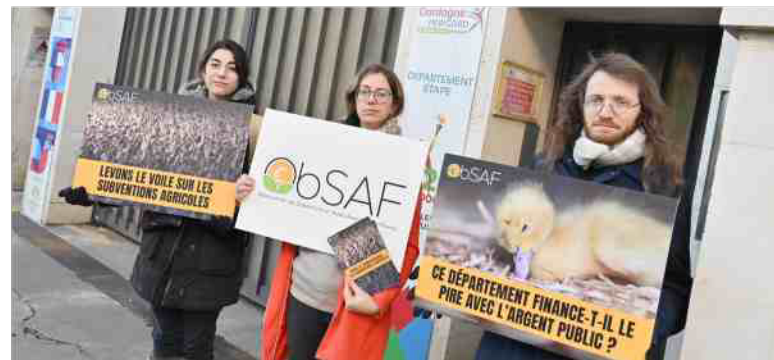
Les militants de l'Obsaf se sont retrouvés devant le conseil départemental, ce lundi.

Ce rapport repose sur l'étude de documents administratifs relatifs aux aides octroyées entre 2022 et 2025 par les départements, la Région Nouvelle-Aquitaine et l'Union européenne. Les membres de l'Obsaf se sont rendus dans tous les départements de la région afin de récolter des informations. Ils ont souvent fait chou blanc. « Nous n'avons été reçus que dans deux départements, la Gironde et les Pyrénées-